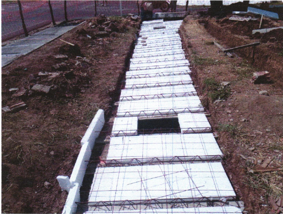
Foto 11 - FABRICAÇÃO, MONTAGEM E DESMONTAGEM DE FORMA PARA RADIER, PISO DE CONCRETO OU LAJE SOBRE SOLO, EM MADEIRA SERRADA, 4 UTILIZAÇÕES. AF_09/2021