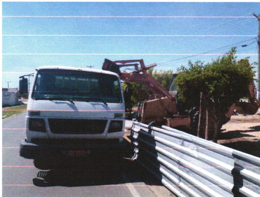
Foto 01 - TRANSPORTE COM CAMINHÃO BASCULANTE DE 10 M3, EM VIA URBANA PAVIMENTADA M3 KM, DMT ACIMA DE 30KM