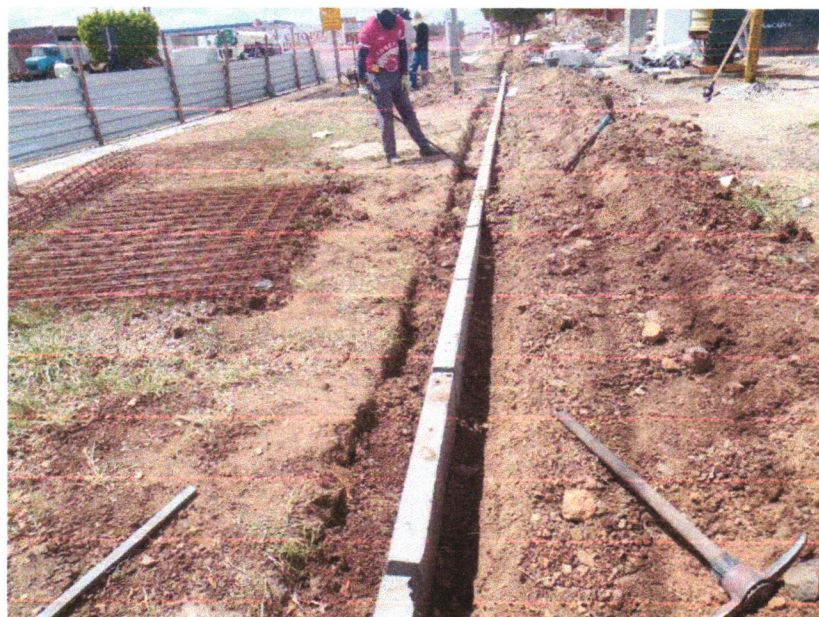
Foto 02 – ASSENTAMENTO DE GUIA (MEIO-FIO) EM TRECHO RETO, CONFECCIONADA EM CONCRETO PRÉ-FABRICADO, DIMENSÕES 100X15X13X20 CM (COMPRIMENTO X BASE INFERIOR X BASE SUPERIOR X ALTURA), PARA URBANIZAÇÃO INTERNA DE EMPREENDIMENTOS. AF_06/2016_P