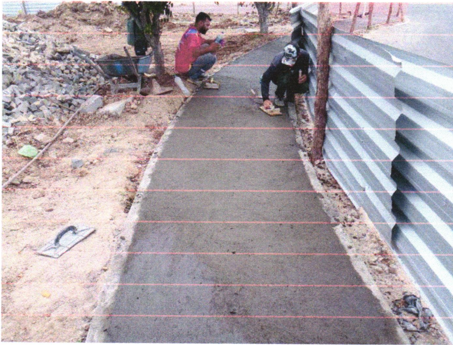
Foto 07 - PAVIMENTAÇÃO EM CONCRETO, COM ESPESSURA DE 7 CM, COM ACABAMENTO FEITO UTILIZANDO ALISADORA DE CONCRETO (HELICOPTERO), INCLUIDO TELA DE AÇO SOLDADA NERVURADA CA60, Q196 (3,11 KG/M 2 ), DIAMETRO DO FIO 5.0 MM, LARGURA = 2,45 M, ESPAÇAMENTO DA MALHA = 10 X 10 CM, JUNTA DE DILATAÇÃO EM PVC A CADA 2,00 M, CONCRETO FCK = 20 MPA