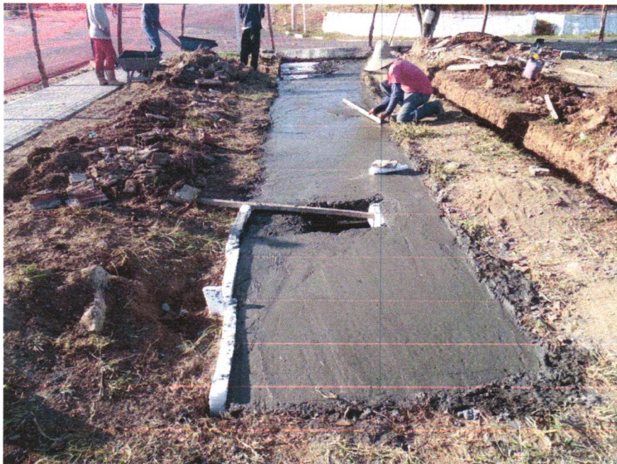
Foto 12 - CONCRETO FCK = 25MPA, TRAÇO 1:2,3:2,7 (EM MASSA SECA DE CIMENTO/ AREIA MÉDIA/ BRITA 1) - PREPARO MECÂNICO COM BETONEIRA 600 L. AF_05/2021