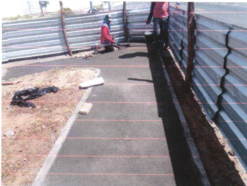
Foto 08 - PAVIMENTAÇÃO EM CONCRETO, COM ESPESSURA DE 7 CM, COM ACABAMENTO FEITO UTILIZANDO ALISADORA DE CONCRETO (HELICOPTERO), INCLUIDO TELA DE AÇO SOLDADA NERVURADA CA60, Q196 (3,11 KG/M 2 ), DIAMETRO DO FIO 5.0 MM, LARGURA = 2,45 M, ESPAÇAMENTO DA MALHA = 10 X 10 CM, JUNTA DE DILATAÇÃO EM PVC A CADA 2,00 M, CONCRETO FCK = 20 MPA