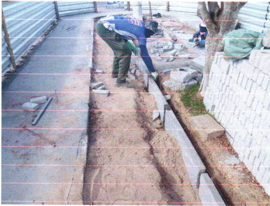
Foto 05 - ASSENTAMENTO DE GUIA (MEIO-FIO) EM TRECHO RETO, CONFECCIONADA EM CONCRETO PRÉ-FABRICADO, DIMENSÕES 80X08X08X25 CM (COMPRIMENTO X BASE INFERIOR X BASE SUPERIOR X ALTURA), PARA URBANIZAÇÃO INTERNA DE EMPREENDIMENTOS. AF_06/2016