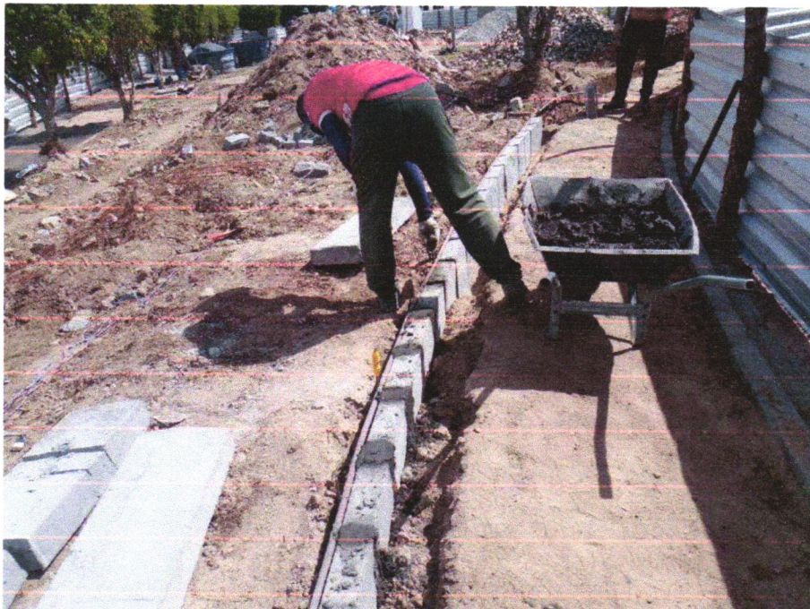
Foto 04 - ASSENTAMENTO DE GUIA (MEIO-FIO) EM TRECHO CURVO, CONFECCIONADA EM CONCRETO PRÉ-FABRICADO, DIMENSÕES 100X15X13X20 CM (COMPRIMENTO X BASE INFERIOR X BASE SUPERIOR X ALTURA), PARA URBANIZAÇÃO INTERNA DE EMPREENDIMENTOS. AF_06/2016_P