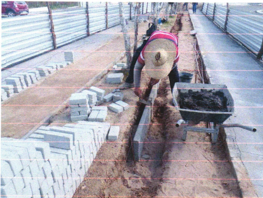
Foto 06 - ASSENTAMENTO DE GUIA (MEIO-FIO) EM TRECHO RETO, CONFECCIONADA EM CONCRETO PRÉ-FABRICADO, DIMENSÕES 80X08X08X25 CM (COMPRIMENTO X BASE INFERIOR X BASE SUPERIOR X ALTURA), PARA URBANIZAÇÃO INTERNA DE EMPREENDIMENTOS. AF_06/2016