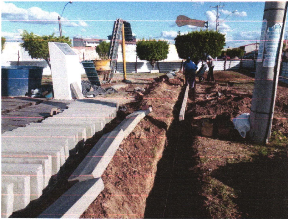
Foto 03- ASSENTAMENTO DE GUIA (MEIO-FIO) EM TRECHO RETO, CONFECCIONADA EM CONCRETO PRÉ-FABRICADO, DIMENSÕES 100X15X13X20 CM (COMPRIMENTO X BASE INFERIOR X BASE SUPERIOR X ALTURA), PARA URBANIZAÇÃO INTERNA DE EMPREENDIMENTOS. AF_06/2016_P